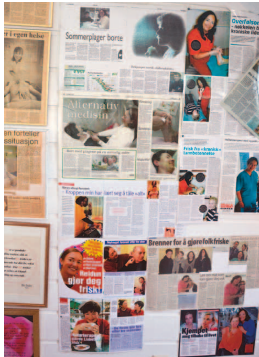
På veggen henger utklipp fra aviser og ukeblader.

- Ja, men likevel anbefaler jeg å spise mye av dette. Det vil alltid være noe pluss/minus uansett hva du velger å spise. Laks spiser jeg også, men ikke så mye. Det sies at de har redusert antibiotika i oppdrettslaks, men er litt